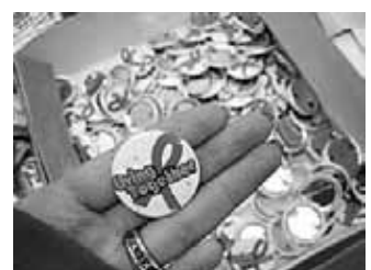
現地のHIV陽性者団体・支援団体も「Living Together」のキャッチフレーズを!