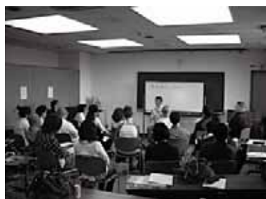
講師を囲んで輪になって話を聞く研修参加者

オリエンテーションに32名の参加希望者があり、研修には25名の参加がありました。参加者の年齢層、セクシュアリティ、社会的な背景は様々でしたが、みなさんワークショップ等を通じて積極的に意見の交換や交流をされており、楽しんでいただけたのではないかと思います。みなさま、研修お疲れさまでした。