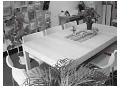
1月から利用開始になった多目的室

今年1月から始まった新プログラムの1つがトークサロン。日ごろ皆さんが疑問に思っていることを、可能な範囲でお互いの経験を共有しつつおしゃべりしながら考える時間で「就職活動を報告しあう会」はほぼ毎月1回のペースで開催、すでにのべ40名以上の参加がありました。その中から、2名の方に寄せていただいた感想文をお届けします。