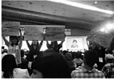
開会式で始まった抗議行動

“Diverse Voices, United Action”(多様な声、結束した行動)がテーマに掲げられた今回のICAAPですが、会議2日目に会場でHIV陽性者の治療アクセスを脅かす自由貿易協定