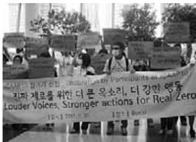
デモは“より大きな声より強い行動”に

とはいえ、以上はハングルがまったくわからないわたしが収集できた情報、英語を話す韓国人かあるいはその他の国の人々から英語で得た情報に偏っているの、あの場で起