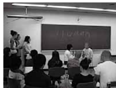
ロールプレイ「メトロ保健所」の一幕

改めて自分に何が出来るかと考える時、もちろん知識も大切だが、他者と接するということかということかということか、今回の研修で教えてもらったと感じている。相手を理