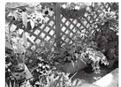
多目的室のベランダは花と緑がいっぱい

事情や病状、年齢や性別もさまざま、集まるメンツもその都度異なるけど、一貫して自由で柔らかな雰囲気があって、とても好きな会でした。仕事が決まった今ではなかなか顔を出せませんが、是非また参加したいと思っています。