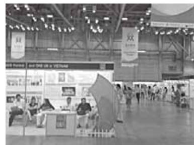
アジア・パシフィック・ヴィレッジの様子

お隣の韓国の状況はというと、日本との共通点も少なくありません。例えば、保健所では無料・匿名で HIV 検査が受け