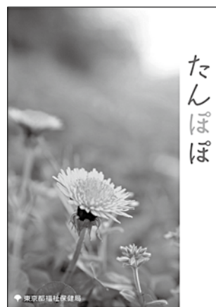
リニューアルした「たんぽぽ」の表紙

http://www.fukushihoken.metro.tokyo.jp/iryo/koho/kansen/files/tanpopo.pdf