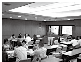
グループごとのワーク

今年は、これまで週に1~2回×3回にしていた日程を、1週間の中で3回も続けて行ったので、これまで以上にハードだったのではないかと思います。参加者のみなさまはいかがだったのでしょうか。本当にお疲れ様でした。これから各部門での研修、ミーティング等があると思いますが、ぜひ細く長く楽しく、ついでに私のようにしつこく活動していただくとうれしく思います。これからもよろしく願います。(文責:まきはら)