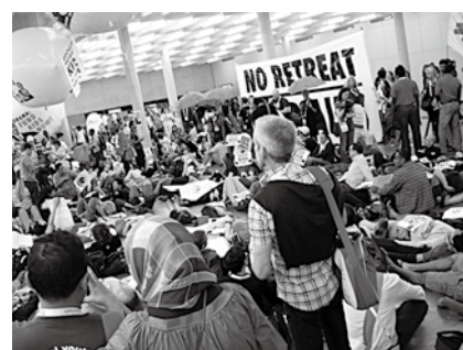
主要国がHIV/AIDS対策への資金拠出を減らしていることに抗議する活動家たちのダイ・イン