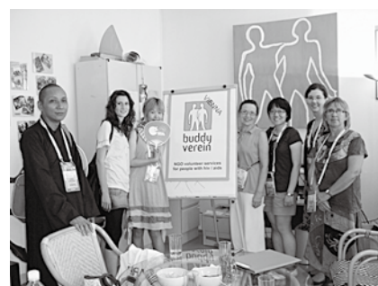
現地のHIV/AIDS支援団体を訪問した際の団体スタッフらとの集合写真