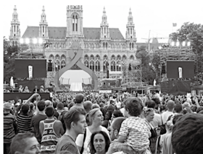
ウィーン市庁舎正面にはレッドリボンが飾られ、イベントも開催された。