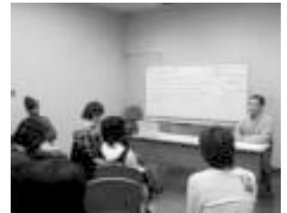
ワークショップの始まり: グラドルルールを確認する