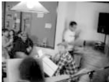
ライブ&リーディング:札幌在住のHIV陽性者の手記が読まれました。

札幌のマスター連合「S.M.A」の一員として、始まりは正直、「お付き合い」で始めた「WAVE さっぽろ」。なんだかんだで4年続けてきました。「ゲイバーでHIVの話はしたくない」言葉は悪いけど、そんな気持ちは今もどこかに