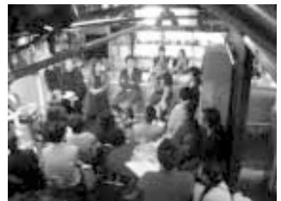
大阪のクラブD'Cで行われたシンポジウム