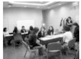
「セックス・アサーティブ講座」の様子

初めてアサーティブやロールプレイを取り上げたので、反省点や課題はたくさんありましたが、楽しくセックスを語る場づくりに成功し、次につながるセミナーとなりました。(報告:みず)