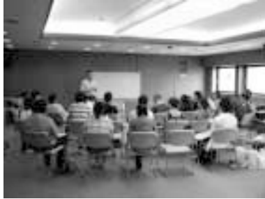
研修の一コマ（3日目より）

気がつけば、今年で数えること6回目、毎年恒例となった各部門合同、新人ボランティア研修会を今年度も開催しました。