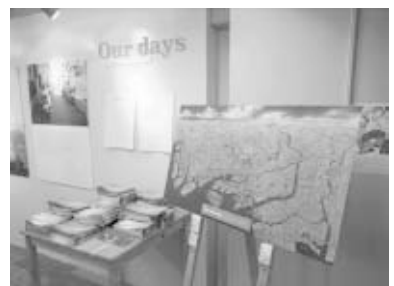
「自分の街」を虫ピンで記していくことができるようになっている地図