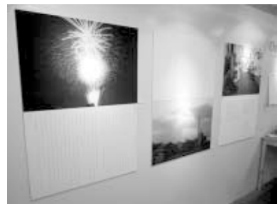
手記と写真を組み合わせたパネル