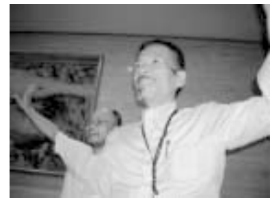
タイのダンスですっかりなごみムード

いろいろな国々の本場の料理が食べられおいしかったです。またエンターテイメントの時間になるとみなさんは一緒にアジアの踊りやラテンのダンスなどを踊ってとても楽しかったです。それから外国人