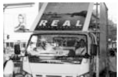
今年のパレードの先頭。メッセージは「REAL」

今年の AIDS のフロートは「REAL」。セクシャリティの多様性も HIV/AIDS の問題も、街の中ではその存在が見えにくい。でも歩く行為は目に見える。だから、街を歩く人達や沿道で手を振ってくれる人達によって作られる時間と空間は、この街でみんなが暮らしているありのまま