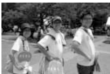
“REAL”の団扇やバッグが会場や沿道にいっぱい!

パレード出発の直前に歩く事を決め、お忙しい中、みなさんをバタバタさせてしまいました。ネストでお世話になっている方々に背中押されての決意でしたが、歩いてみたら達成感があ