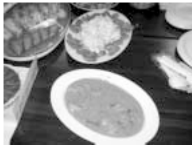
いろいろな料理がテーブルに

この度のプラスランチパーティーは第3回ということで、私は第2回から引き続き2回目の参加をさせて頂きました。世界各国の珍しい手作りの御料理もお腹いっぱいゆっくりと食べることができまし、食事の後はタイの盆踊り風？なダンスなどみんなで輪になって踊ったりして楽しめました。