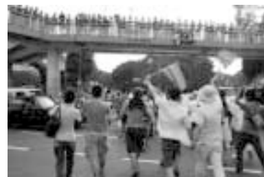
沿道応援が歩道橋の上にも

のプラカードやレインボーフラッグを持ったお仲間さん、デート途中のノンケカップル、仕事中のショップ店員さん、親子連れetc...沿道に向かって手を振るとそんな皆が手を振って応えてくれたり声をかけてきてくれたり。パレードと一緒に歩いた友人ゲイカップルのキスシーンにカメラのフラッシュに祝福の拍手。