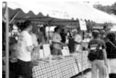
NGO やエイズ予防財団の共同ブース

今年はエイズ予防財団のブースを、JaNP+ と Rainbow Ring とぶれいす東京で運営しました。チョット寝坊して会場に着くと、もう結構な人がフロートの受付に並んでいて、早速、