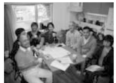
引っ越しを終えて新しい事務所にて...

ぶれいす東京の事務所は、2007年10月8日移転いたしました。電話・FAX・メール等の連絡先は従来と変わりません。住所のみ、同じマンション内の1階下に移動しました。今後ともご支援・ご協力をよろしくお願ひいたします。