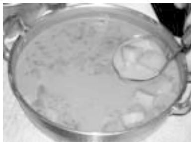
あたたかいタイのデザート「プッワーツ・マン」

生まれ育った地元で病気を明らかにして交流活動をしていくのは難しい場合があります。今回は地元を離れ、このランチパーティーに参加することで、普段抑えている心を解放することもでき、気持ちもぐっと軽くなり、帰ってくることができました。