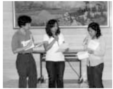
アーユス、TAWAN、SHARE 合同の寸劇

何とか HAART を開始することができたが、その心中はいまもなお穏やかではないだろう。帰国した A さんは、いつ政府の支援が縮小されてしまうかわからない不安の中での治療である。日本で治療を始めた B さん